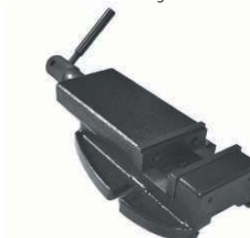
Etau EP 100 BF